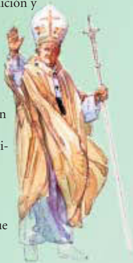
Illustrations by Kevin Davidson

Los Católicos creen que Jesús nombró a San Pedro como el primer líder de la Iglesia. El evangelio de Mateo tiene la indicación bíblica más directa del papado: “Y ahora yo te digo: Tú eres Pedro (o sea Piedra), y sobre esta piedra edificaré mi Iglesia; los poderes de la muerte jamás la podrán vencer. Yo te daré las llaves del Reino de los Cielos: lo que